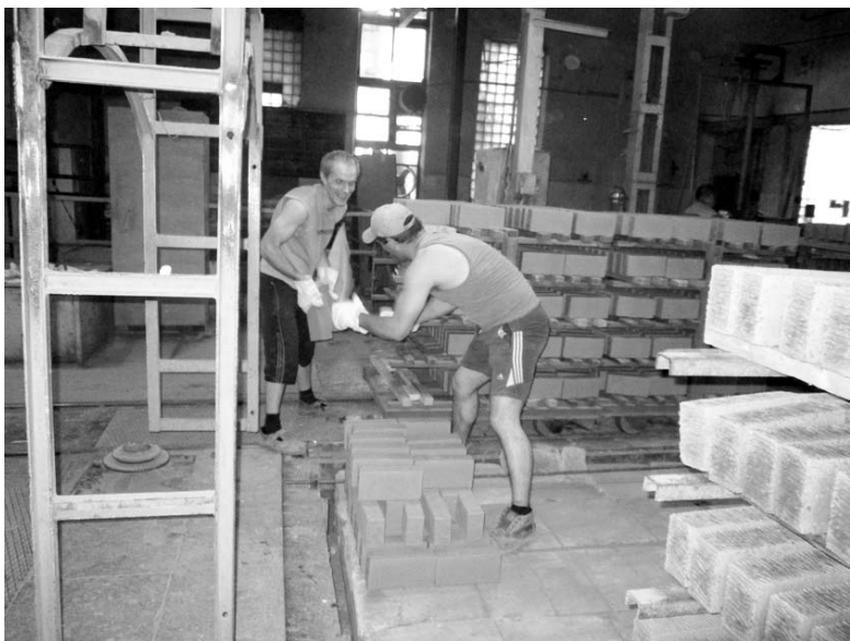
Кирпичный цех №1.

Профсоюзный комитет делает все возможное, чтобы все работники – и рабочие, и инженерно-технические кадры – были объединены не только профессиональной деятельностью, но и досугом, чтобы профсоюз участвовал в жизни каждого сотрудника, помогал решать