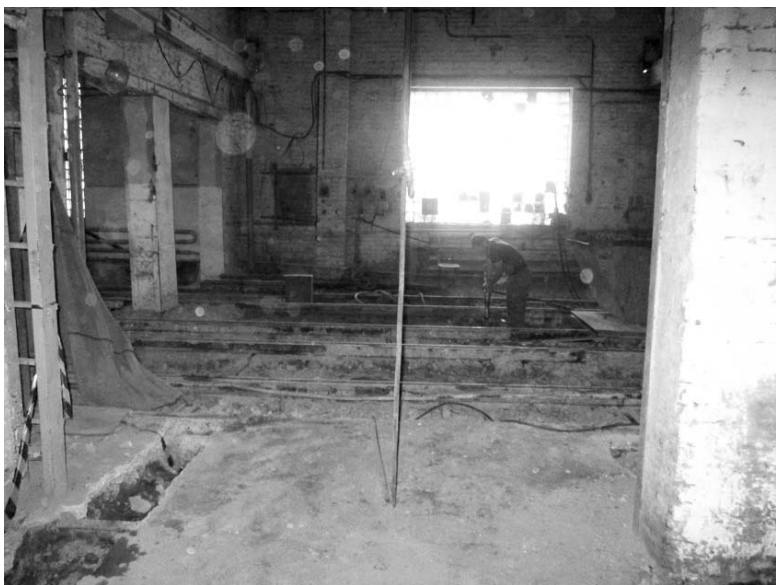
Место для нового оборудования.

Профком помогает всем работникам (не только членам профсою-